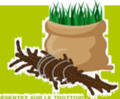
PRÉSENTEZ SUR LE TROTTOIR