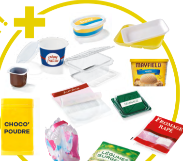
Pots (crème, yaourt), boîtes et barquettes (beurre, jambon, viande), sachets (de légumes), films (de pack d'eau), tubes (de dentifrice), etc.