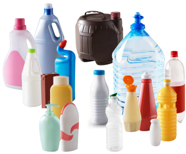
Bouteilles et flacons avec leur bouchon