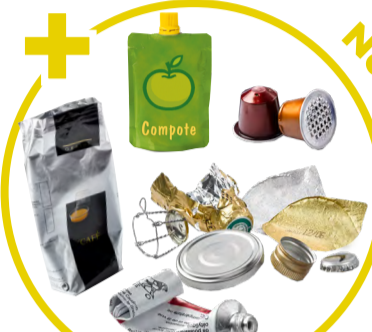
Capsules, sachets, boîtes, tubes, opercules, boules de papier aluminium