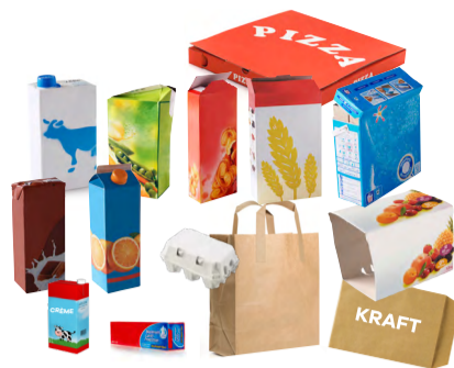
Cartons et briques alimentaires vides