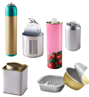
Bidons de sirop, canettes, conserves, aérosols, barquettes en métal